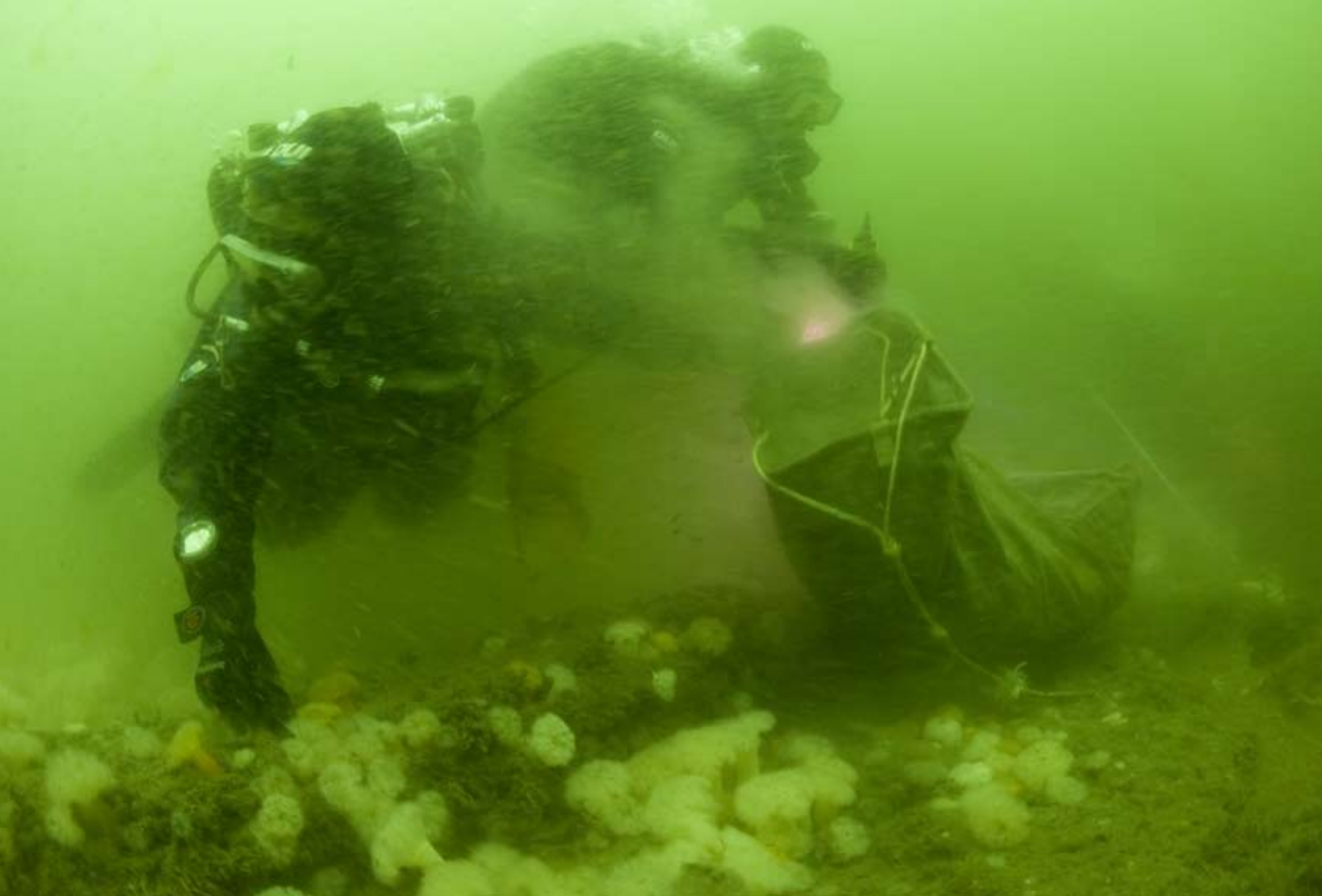
Hard werken - Het stroomt nog flink, maar dat is nu een zegen. Het opdwarrelende stof spoelt zo weg.