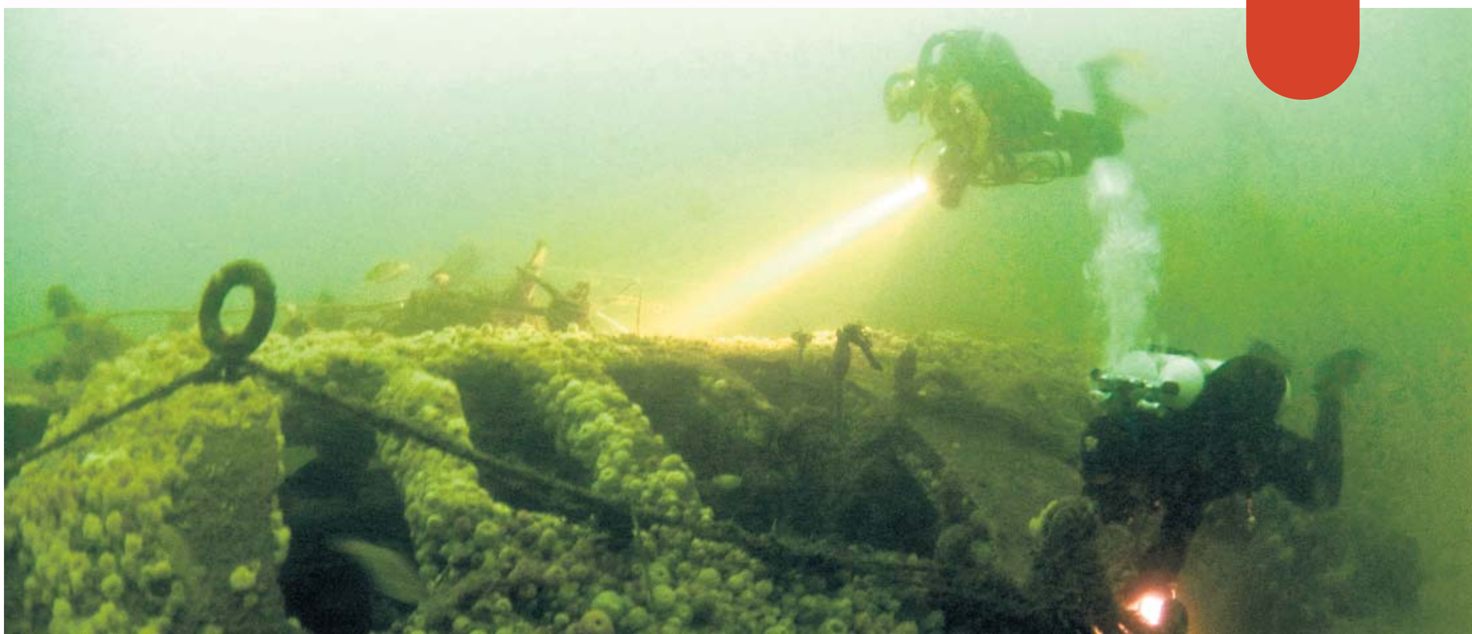
Wrakduiken op de Noordzee: overal lijnen, trossen en netten.